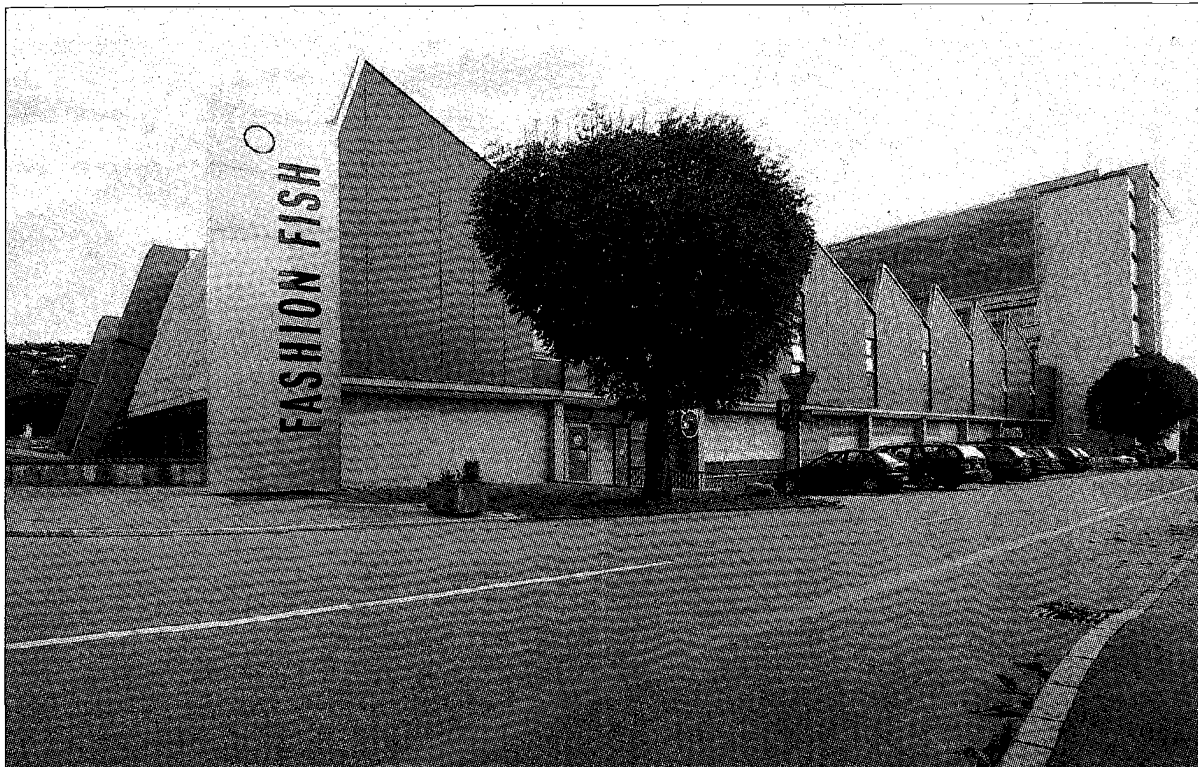
GROSSER LADEN Bally bleibt mit seinem Outletstore bis 2013 in dieser Halle in Schönenwerd eingemietet.