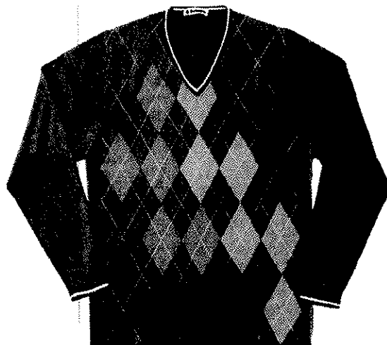
SEGELN VOR VALENCIA V- Neck-Pullover von Burlington gibts in diversen Farben. → 84.- statt 120.-