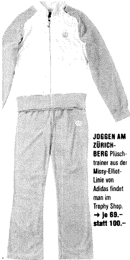
JOSSEN AM ZÜRICH- BERG Plüsch- trainer aus der Missy-Elliot- Linie von Adidas findet man im Trophy Shop. → Je 69.- statt 100.-