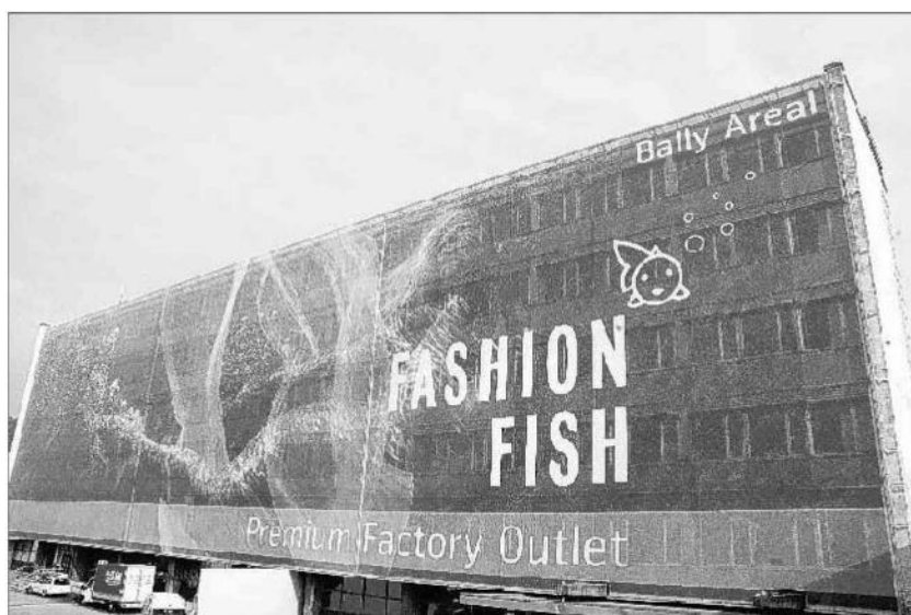
BLICKFANG Am Büroturm der früheren Bally-Fabrik prangt nun ein Riesen-Poster des neuen Outlet «Fashion Fish». 07